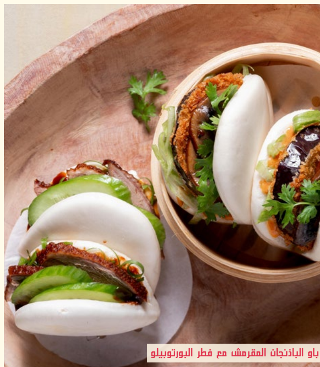
باو الباذنجان المقرمش مع فطر البورتوبيلو

بط طري بصلصة الصويا الحلوة الكثيفة، متبللة بمذاق القرفة المنعش وورق الغار. تقدم في خبز الباو المطهو على البخار.