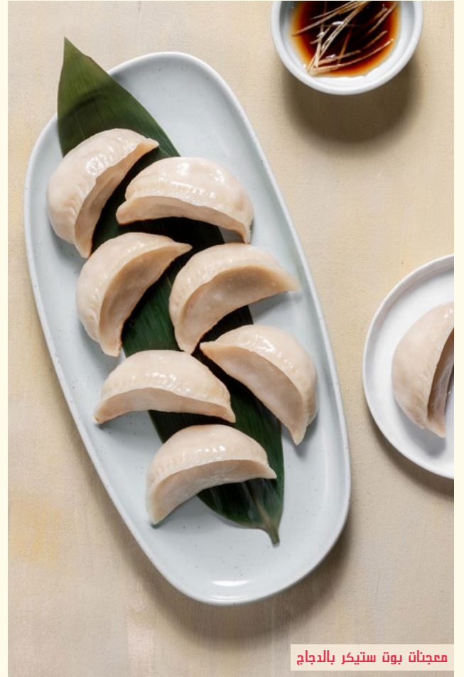
معجنات بوت ستير بالدجاج

دامبلينج مطهوه البخار تقدم في وعاء اليامبو للطهو بالبخار، ما يجعلها الوجبة المفضلة لعشاق الخضار. محشوة بالبوك تشوي والتوفو المجفف والفطر والنودلز.