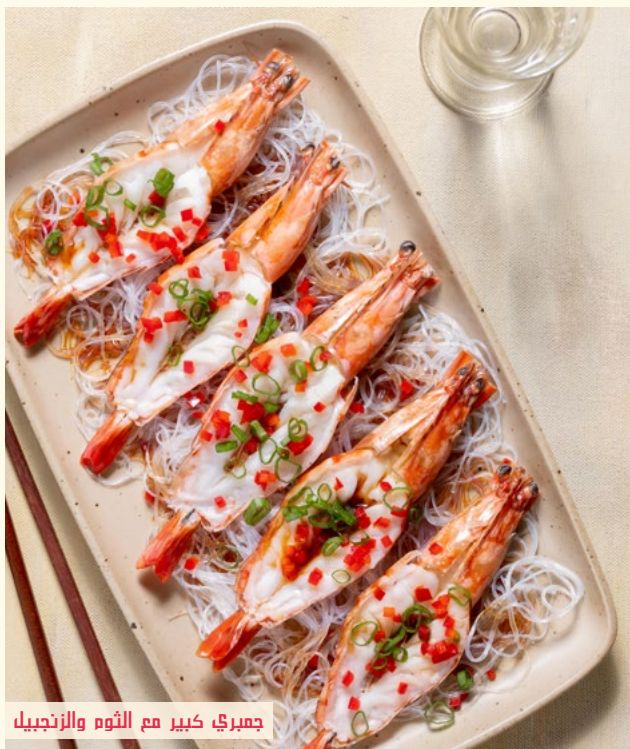
جمبري كبير مع الثوم والزنجبيل