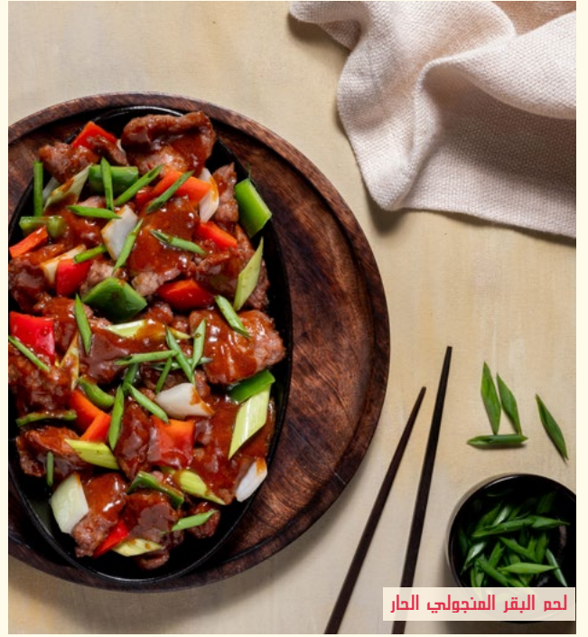
لحم البقر المنجولي الحار