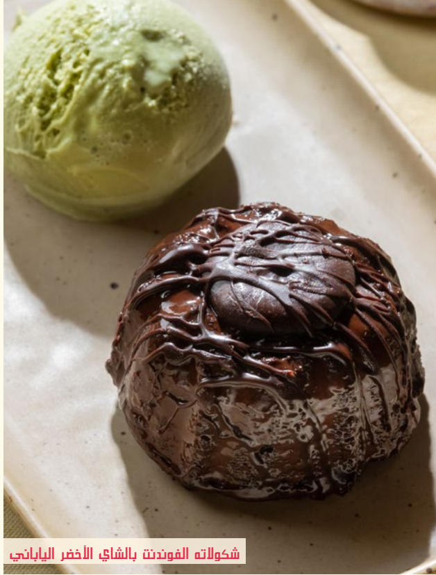
شكولاته الفوندنت بالشاي الاخضر الياباني