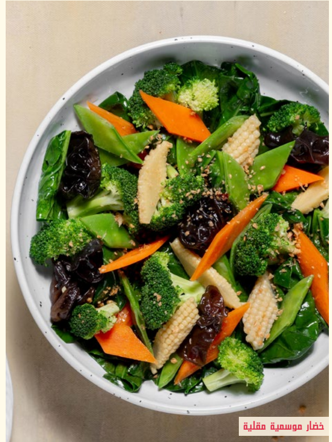
خضار موسمية مقالية