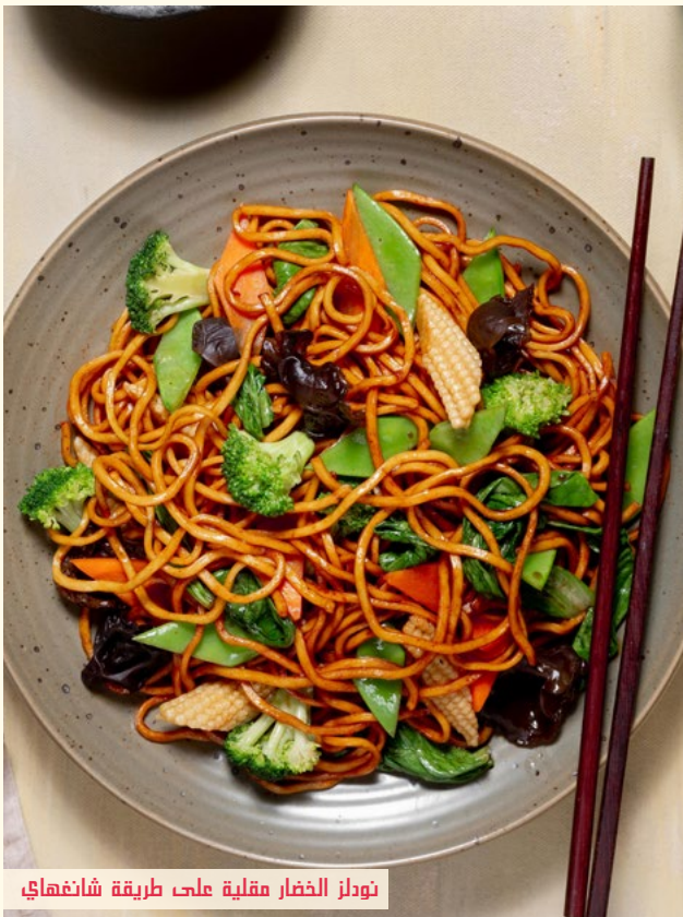
نودلز الخضار مقالية على طريقة شانغهاي