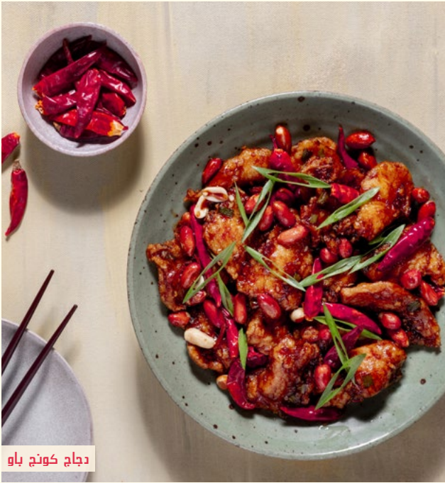
دجاج كونج باو