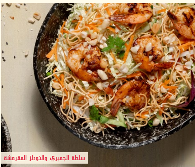
سلطة الجمبري والنودلز المقرمشة

ملفوف صيني، خيار، جزر، كزبرة، ملفوف، مقدمة مع نودلز البيض المقرمش ومتبللة بتتبيلة الفول السوداني الحارة.