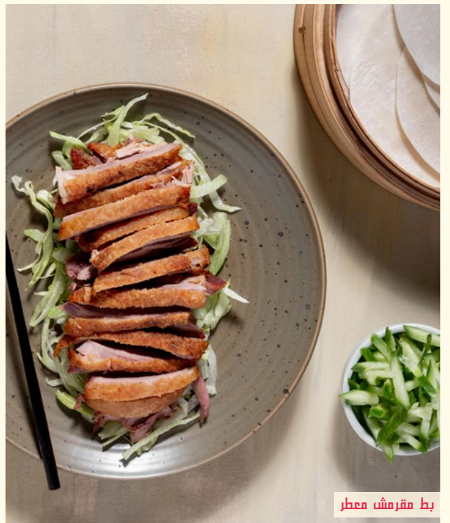
بط مقرمش معطر