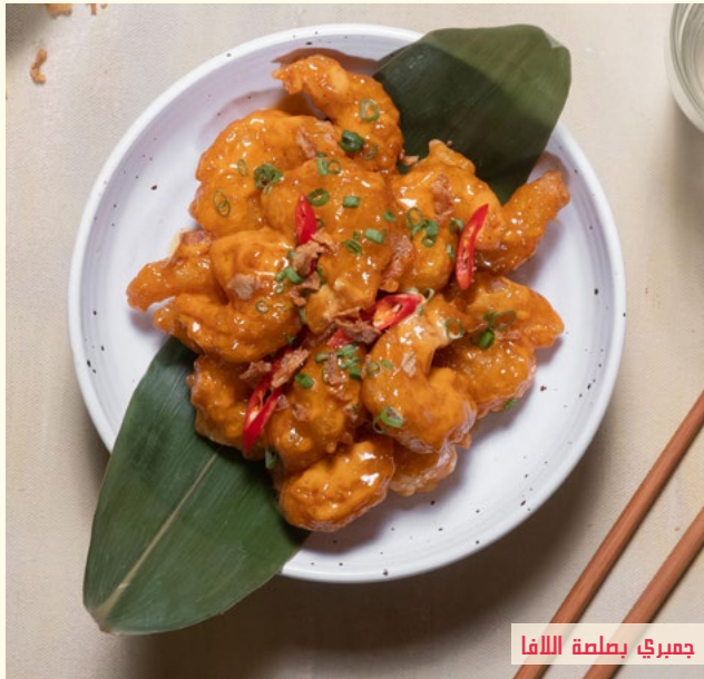
جمبري بصلصة الالفا