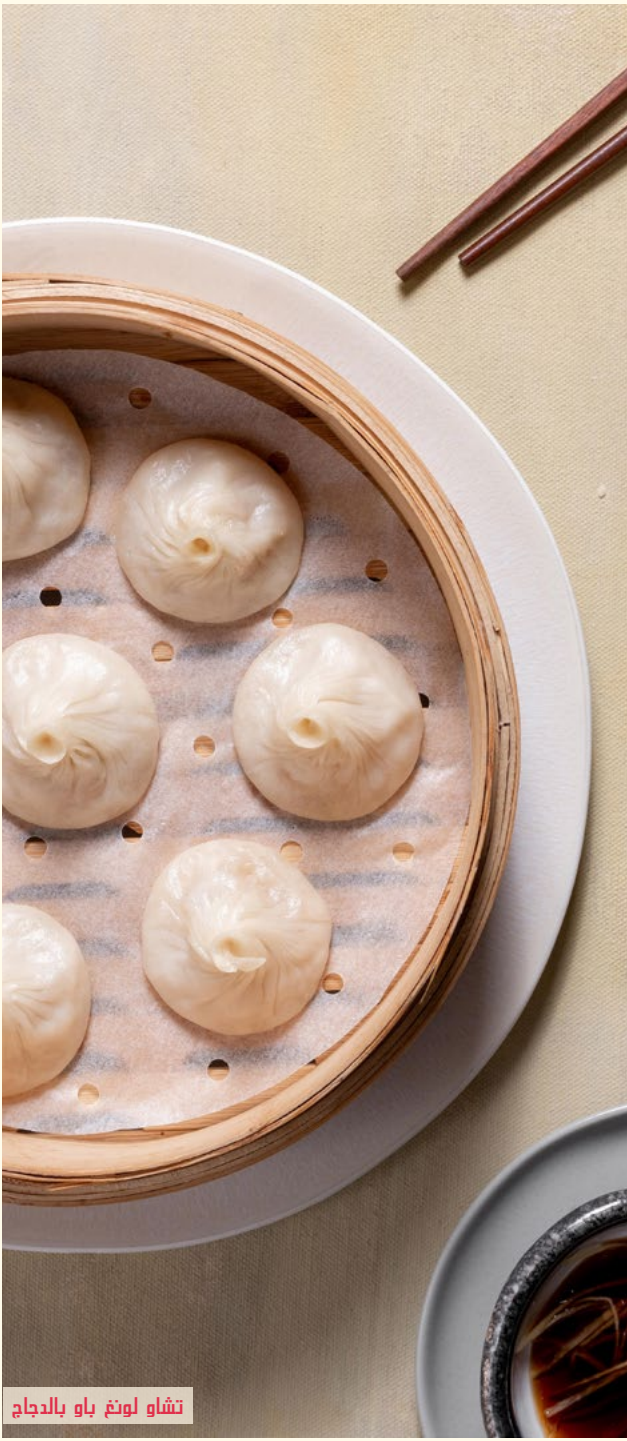
تشاو لونغ باو بالدجاج